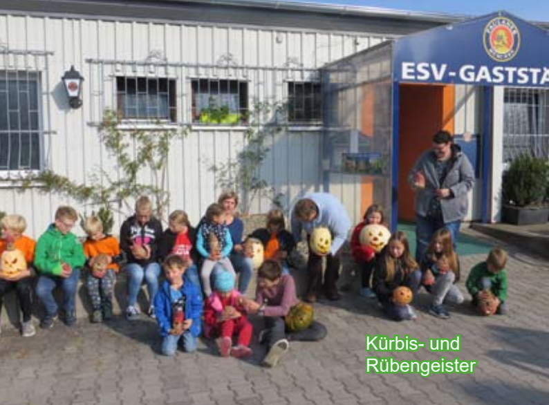
Kürbis- und Rübengeister